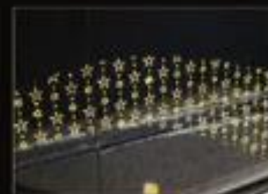
ラグジュアリーなオリジナルデザイン