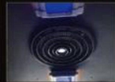
バス内の空気を常に 入れ替えてくれる大型換気扇