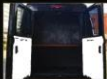
ゴルフバッグやスーツケースが 多く入る大型トランク