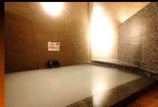
シルクバス(右の湯)

サウナストーンに水をかけ蒸気が発生。汗と毒素を排出するデトックス効果があります。