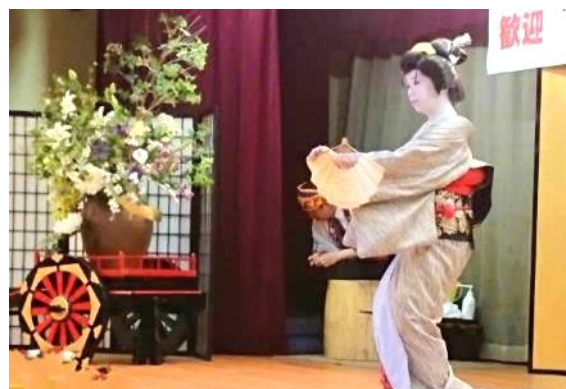
芸者による舞踊と歓迎挨拶