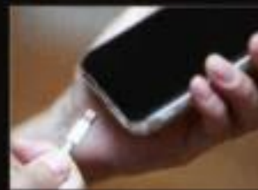
USBソケット付きで充電も安心