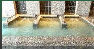
ジェットバス(左の湯)

湧き出す気泡の発振する超音波で血行を促進します。 女流作家による砥部焼陶板壁画も必見。