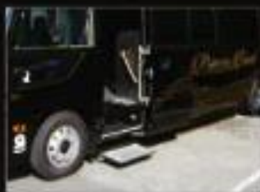
乗り降りしやすいステップ