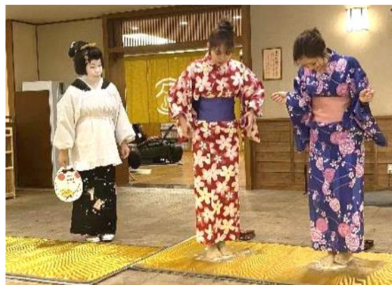
芸者による金の讃岐うどんショー