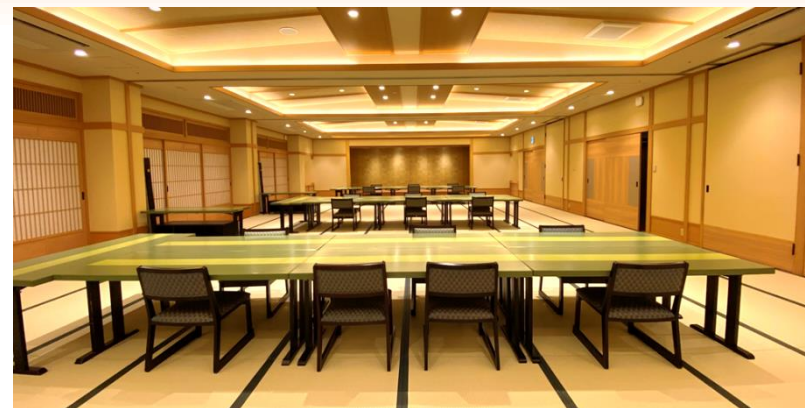
◆竹の間(3階)(イメージ)