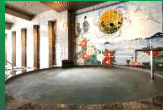
バイブラバス(左の湯)

湧き出す気泡の発振する超音波で血行を促進します。 女流作家による砥部焼陶板壁画も必見。