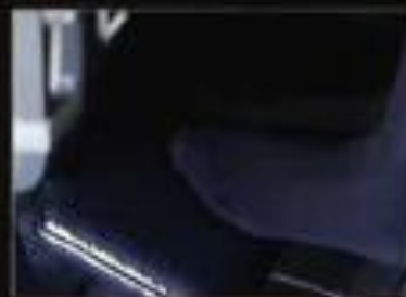
座席下部のフットレストでリラックス