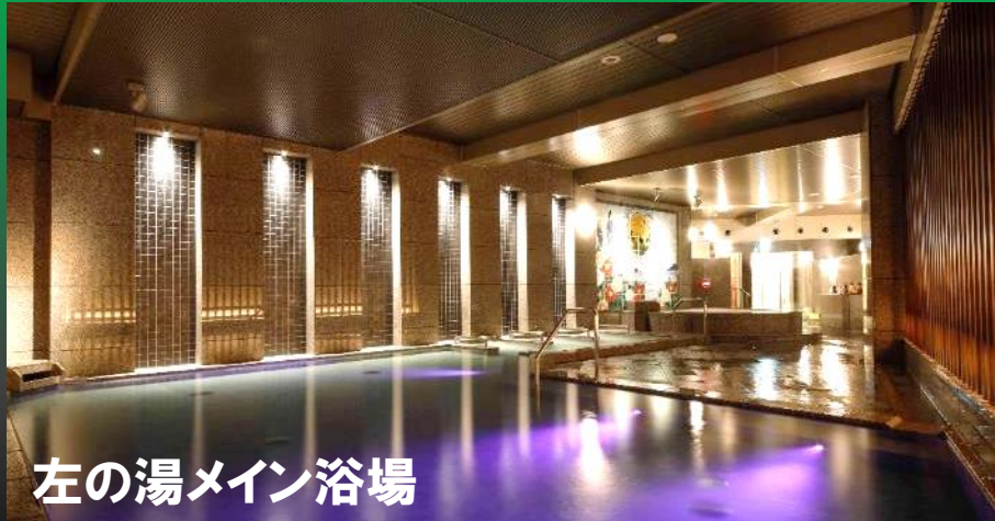
左の湯メイン浴場