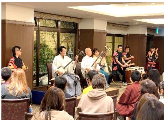
水軍太鼓と津軽三味線の共演