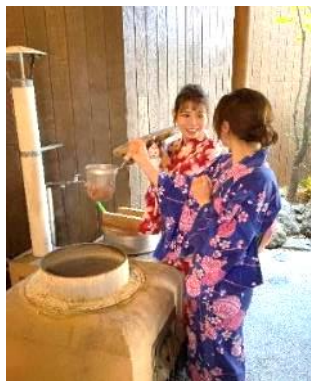
温泉ゆで玉子作り体験(有料)