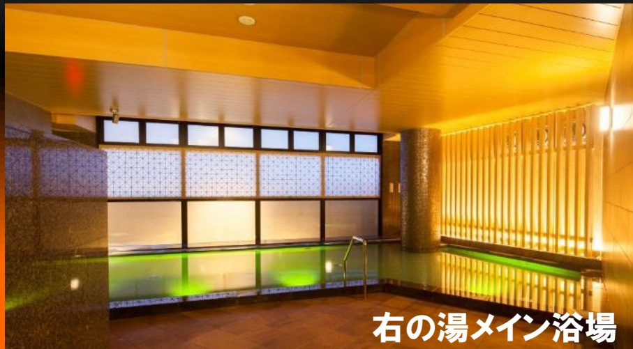
右の湯メイン浴場