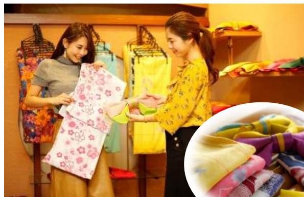
色浴衣貸出し(有料)