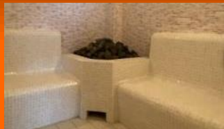
スチームサウナ(右の湯)

身体を心地よく刺激する温度と蒸気が全身を温かく包み、汗と一緒に老廃物を洗い流し、美しい肌をつくれます。