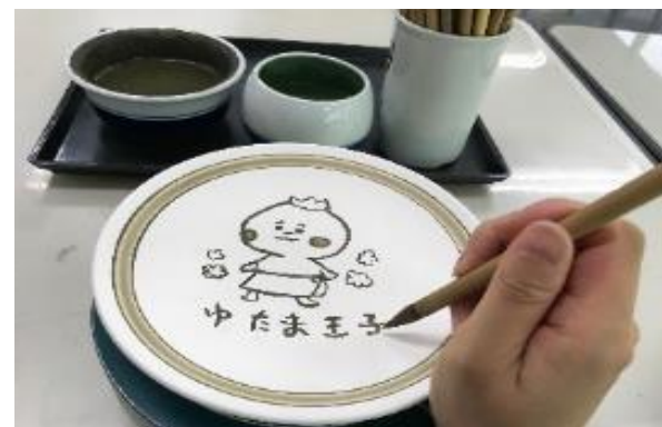
砥部焼絵付体験(県指定文化財/有料)