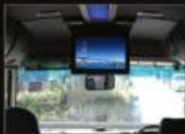
正面のTVモニターで移動中も楽しめる