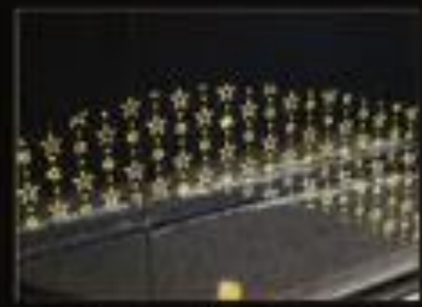
ラグジュアリーなオリジナルデザイン