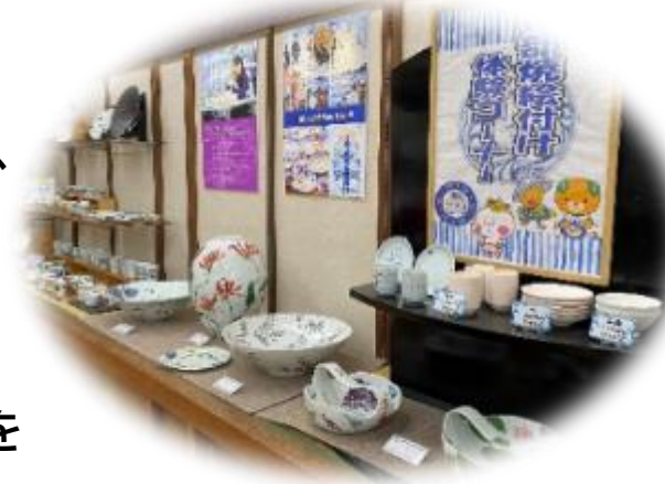
伝統工芸品 砥部焼ギャラリー

また、弊社では、プレミアムバスやオープントップバスを活用し、この宿の駅を始発駅として、生産者の故郷やその周辺の魅力をお伝えするためにオリジナルツアーの企画造成にも取り組んでいます