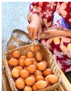
温泉ゆで玉子作り体験(有料)