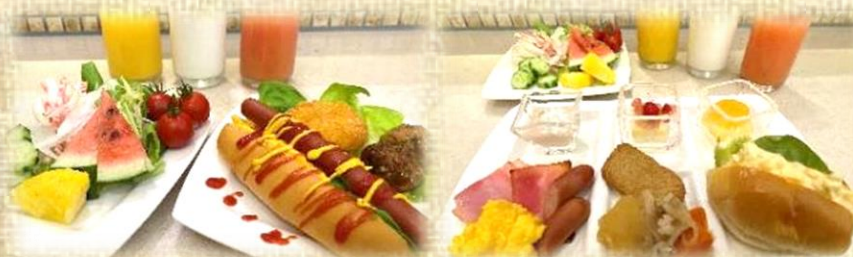
お客様ご自身がつくる ホットドッグ & サンドイッチ