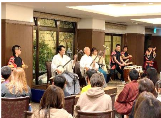
水軍太鼓と津軽三味線の共演