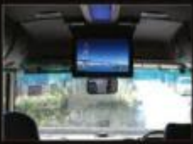
正面のTVモニターで移動中も楽しめる