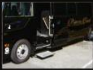
乗り降りしやすいステップ