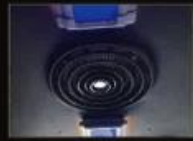
バス内の空気を常に 入れ替えできる大型換気扇