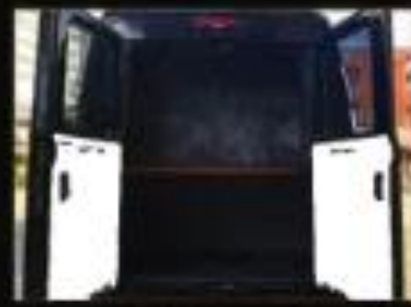
ゴルフバッグやスーツケースが 多く入る大型トランク