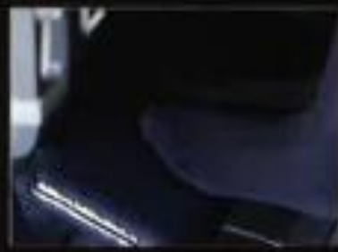
座席下部のフットレストでリラックス